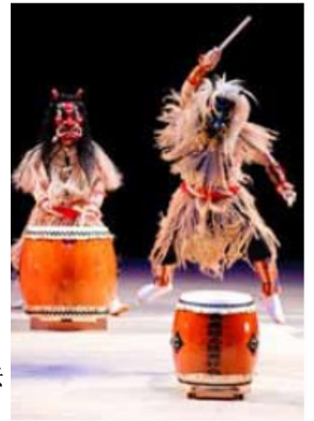
生剥鬼节 太鼓表演