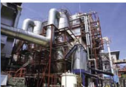
粉碎 残留 处理 设备

*NPO法人全日本汽车回收再利用事业联盟自2004年创立以来, 是以推进汽车拆卸业的国际合作和全球报废车辆回收处理流程科学化为目的, 努力为地球环境保护做贡献的非营利组织。