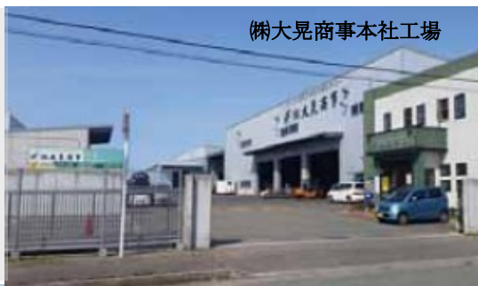
(株)大晃商事本社工場

*当法人は、解体事業者が国際的に連携し、地球規模で自動車リサイクルと廃車適正処理の推進を図り、地球環境保全に貢献する目的のために2004年に設立されたNPO団体です。