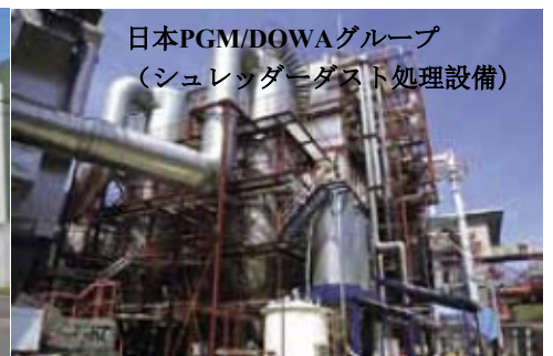
日本PGM/DOWAグループ (シュレッターダスト処理設備)