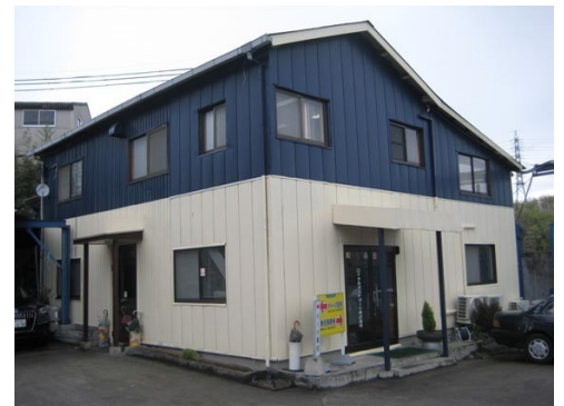
일간 자동차신문 4월 23일(목)