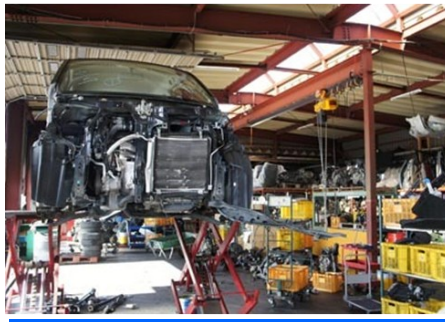
该公司工厂进行报废车买入和正确处理、零部件生产