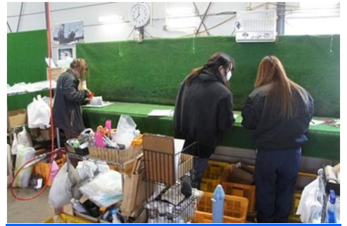
女性员工担当商品化登录、捆包等