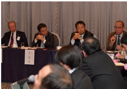
面向业界发展展开激烈讨论