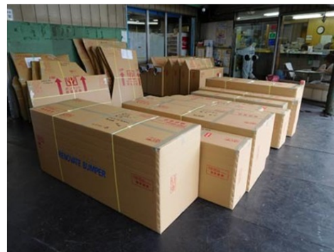
物流费的高涨影响了零部件的流通