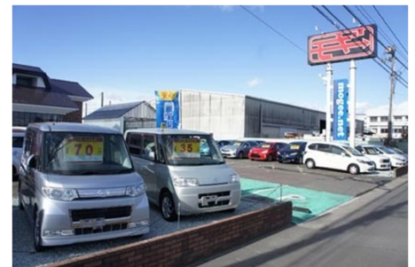
名取店主要进行二手车销售、买入、再利用零部件销售等