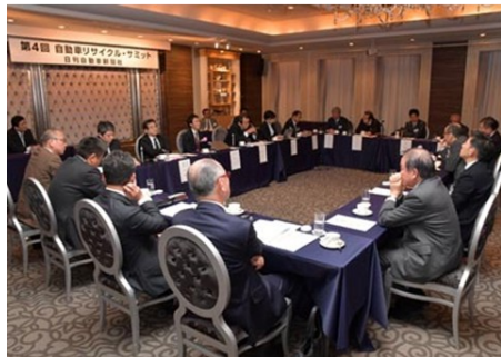
产官学的汽车再利用相关者汇聚一堂