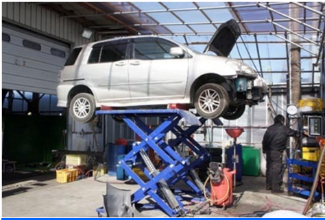
考虑更有效率的经营方针