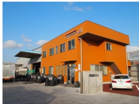
由于在约2800平方米的场地上 建立总公司专用办公室