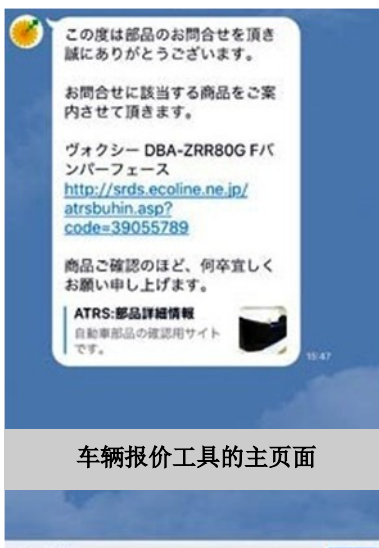
车辆报价工具的主页面

另外，考虑到客户会使用智能手机或平板电脑浏览商品信息画面，重新制作了与移动终端相