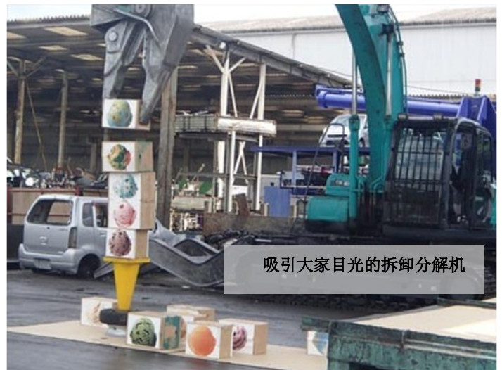
吸引大家目光的拆卸分解机