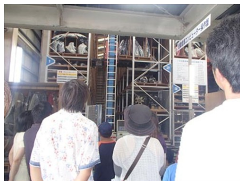
参观了放置约2万5千件回收 再利用零部件的仓库