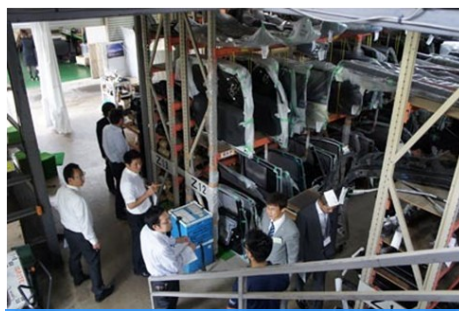
通过对公司参观学习参加者们交换了意见建议。