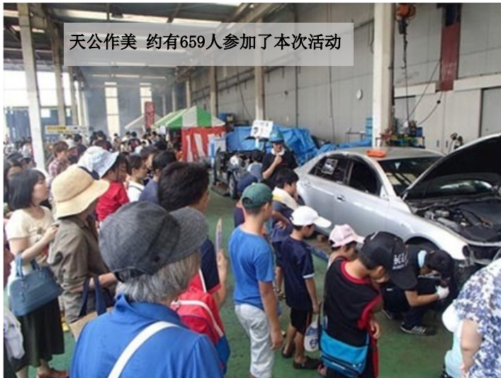
天公作美 约有659人参加了本次活动