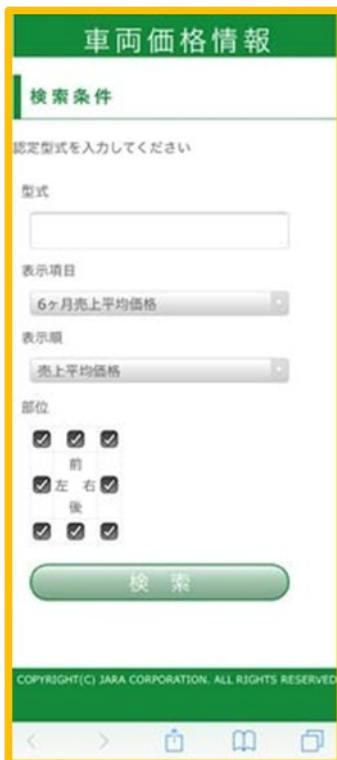
車両見積もり支援ツールのトップ画面