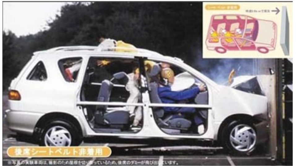
后排座椅如果不使用安全带,事故发生时乘车人员会被甩出车外

现行的法律中没有规定巴士的辅助座席需要加装安全带，今秋会对法律进行更改，大型巴士车从2017年10月，面包车等其他巴士车从19年10月开始依次安装。另外，汽车企业任意加装的安全带，在设计上也要求要有一定的安全性。